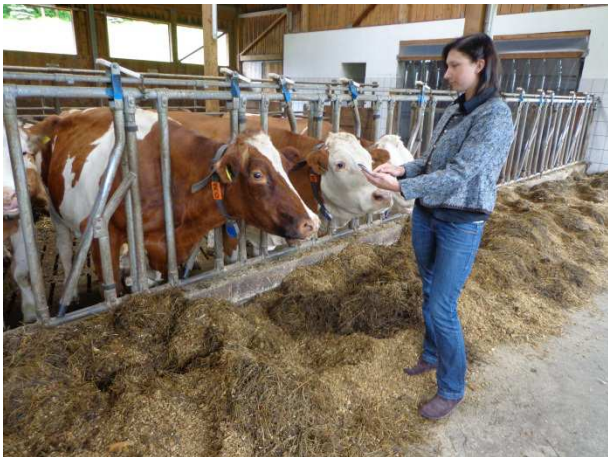
Mit der App RDV mobil haben Sie alle Informationen über Ihre Herde immer in der Hosentasche.