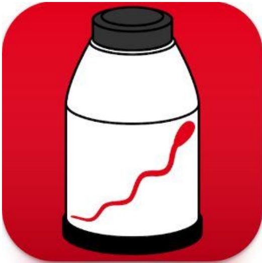
Abbildung 1: Logo RDV Container App